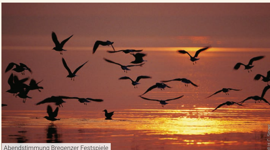
Abendstimmung Bregenzer Festspiele