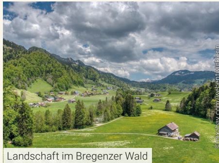
Landschaft im Bregenzer Wald

Nach dem Frühstück Fahrt nach Bregenz. Bei einer Bühnenführung werfen wir einen spannenden Blick hinter die Kulissen der monumentalen Seebühne, für deren Gestaltung der Regisseur und Bühnenbildner Philipp Stölzl („Rigoletto“) verant-