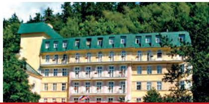
Kurhotel zum Wohlfühlen. Freundliches und zuvorkommendes Personal.

Das Ensana Health Spa Hotel Vltava ist ruhig gelegen und bietet eine bezaubernde Aussicht auf das Panorama Marienbads. Das Stadtzentrum ist innerhalb eines ca. 10-minütigen Spaziergangs zu erreichen.