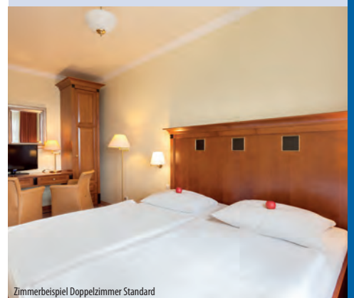
Zimmerbeispiel Doppelzimmer Standard

Hinweis: Für medizinische und physiotherapeutische Leistungen ist der Veranstalter lediglich Vermittler. Zu eventuellen Kontraindikationen erkundigen Sie sich bitte beim Buchungsteam oder auf unserer Webseite. Mobilitätshinweise: Bei eingeschränkter Mobilität ist vor Reisevertrag mit Ihrer Buchungsstelle die Eignung des Hauses für Sie individuell zu prüfen. Eine ausführliche Beschreibung finden Sie auch auf unserer Webseite.